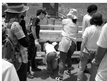
2015年7月江戸川区 篠崎ピオトープ