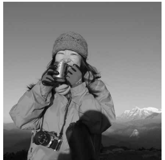
あったかいチャイを飲みながら日の出を見た@ネパール