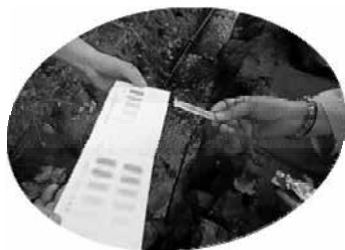
2015年7月目黒区 駒場野公園ケルネル田んぼ。 試験紙と指標の色と比べて、水の汚染度を調べています。

水の様子（色、ニオイなど）川幅や川底は見えるか、見つけた生きものなども報告します。