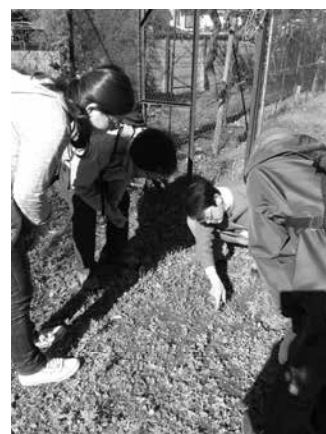
2015年11月世田谷区 大平農園