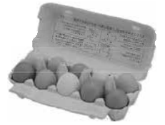
まちのおすすめ消費材 「鶏卵」