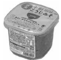
まちのおすすめ消費材 「国産十割こうじみそ」 (カップ 500g・袋 750g)

★鶏のムネ肉にはイミダペプチドというアミノ酸の結合体がたくさん含まれています。これは最高の疲労回復物質です。夏の疲れが出やすいこの時期、食材としては最適です。お財布にも優しいので、ぜひ試してください。