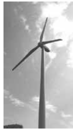
生活クラブ風車 夢風

自然エネルギー由来の電気を選ぶことは、「原発はいらない!」という意思表示でもあります。