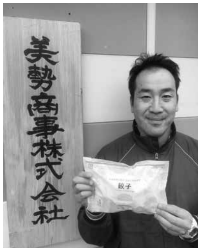
美勢商事株式会社 営業企画部