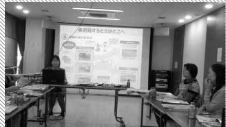
2016年11月 区の防災担当係長を呼んで 「マンションの防災対策講座」