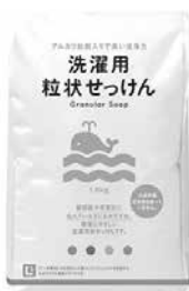
洗濯用粒状せっけん

洗浄力とコストで選ぶなら、粉末タイプがおすすめ。 はじめての方には液体タイプがおすすめ。