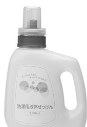
洗濯用液体せっけん