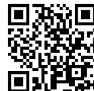
生活クラブ連合会せっけん動画