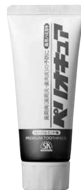
薬用ハミガキ ペリオキュア