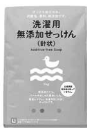
洗濯用無添加せっけん(針状)