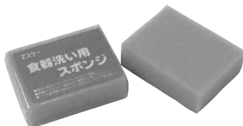
食器洗い用スポンジ 2個組