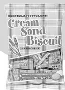
全粒粉入りビスケットクリームサンド 205g(226円)