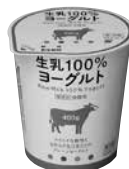
生乳 100%ヨーグルト 新生酪農(株)