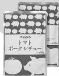
トマトポークシチュー 160g×2(630円)