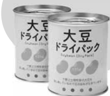
大豆ドライパック缶 135g×2(353円)