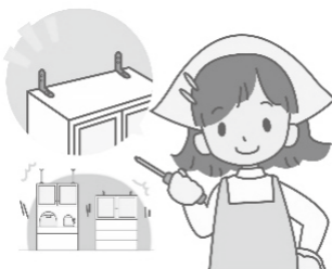
家具を固定した部屋の様子 家具を固定しなかった部屋の様子