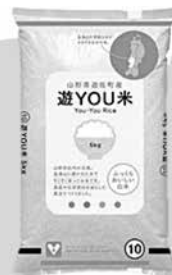
遊 YOU 米 5kg (1,993円)