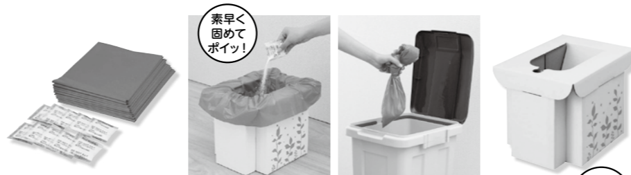
緊急用組み立て式トイレ 1,980円(税抜配送価格)

非常用トイレを使うことになったら、できれば便と尿は分けた方が臭いが抑えられます。埋めても臭いは抑えられないことを覚えておきましょう。また、マンションやアパートなど、大地震の際はトイレの排水が逆流する恐れがあり、要注意です。