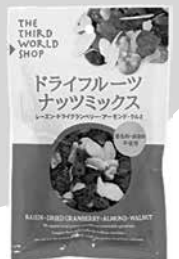
ドライフルーツ ナッツミックス 90g(440円)