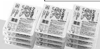
ひとめぼれ(パックごはん) 200g×12(1,600円)