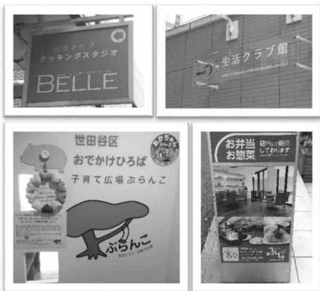
23 区南組織概要 2020 年 5 月末現在

2 階には「子育て広場ぶらんこ」があります。世田谷区のおでかけひろばになっていて、0～3 歳児と保護者が集う広場です。緊急事態宣言が解除され段階的に利用が再開し、行き来する親子の姿が戻ってきました。