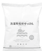
⑥洗濯用粒状せっけん