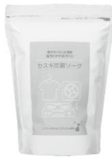
⑪セスキ炭酸ソーダ