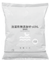
⑤洗濯用無添加せっけん(針状)