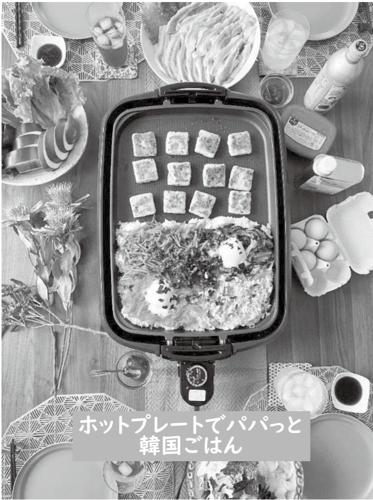
ホットプレートでパパッと韓国ごはん

久しぶりに友達とランチしたいな、家族で出かける? でもお店は混んでいるかもしれないし、ゆっくりしたいな。そんなときは、消費材で手軽にパパッと準備してみるのもいいですよ。