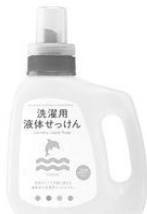
⑦洗濯用液体せっけん★