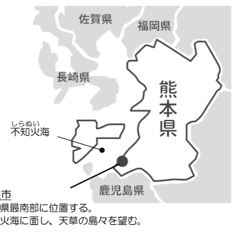
水俣市 熊本県最南部に位置する。 不知火海に面し、天草の島々を望む。

「きばる」とは「がんばる」という意味の九州地方の方言で、熊本県水俣市を中心に広がる不知火海周辺の生産者グループの名称です。生活クラブとは40年以上の関係を築いてきました。