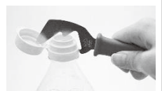
*プラキャップを取りマウス