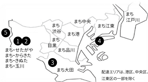
23区南組織概要 2022年11月末現在