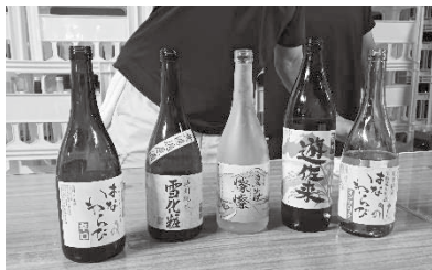
左から 2 番目が原酒

蔵の地下に流れる鳥海山の雪解け水を使って洗米し酒を仕込んでいます。その水自体がすっきり爽やかな味で、出来上がるお酒の味を感じました。玄米から新酒ができるまで約 60 日かかるそうで、夏は仕込みの時期ではありませんでしたが、酒造りの製造工程を一通り見学できました。その後の楽しい利き酒タイムでは 5 種類の酒を試飲し、貴重な無濾過原酒も試飲してきました。