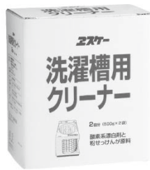
洗濯槽用クリーナー 500g×2 806円

せっけんの泡立ち方は 水の硬度にも関係するた め、例えば使用量の目安が 粒状せっけんをすりきり1 杯で洗濯してみて泡立ち がなかった場合は、次回か ら山盛り1杯で洗濯してみ る等、自宅の洗濯機でのち ょうどよい使用量を試して みてください。