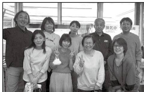
「介護技術リーダー研修」最終回の集合写真

その人らしい尊厳のある暮らしをサポートする悠遊を応援しましょう。引き続き3月までカンパを受け付けます。注文番号が新しくなっていますので、ご注意ください。