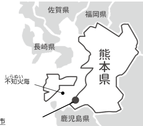
水俣市 熊本県最南部に位置する。 不知火海に面し、天草の島々を望む。

不知火海沿岸は、「公害の原点」と言われる水俣病の被害地域です。海(漁業)を生活の糧としていましたが、その海が汚染され、陸(甘夏栽培)への転換を余儀なくされました。そして「被害者が加害者にならない」というスローガンのもと、低農薬・有機栽培をはじめました。生産者の真摯な姿勢に生活クラブの組合員が共感し、甘夏みかんを食べて応援しようと、1977年に提携が始まりました。