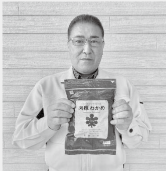
重茂漁業協同組合