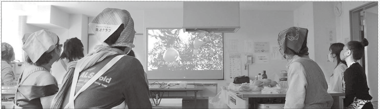
【きばるの甘夏みかんを使った料理を作ってみよう！】生産者から届いたビデオを視聴してから調理しました。

配送・集金についてのお問い合わせはコールセンターへ 03-5426-5218 (月～金 9:00～19:00)