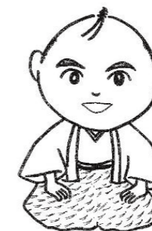
マスコットキャラクター 松葉の介

これまでの経緯や松葉の調査の意義、プラスチックをどうして燃やしてはいけないのかなど丁寧な説明でわかりました。そして、何よりヨーロッパの焼却施設よりも日本の焼却施設の数が多いことに驚き、ごみ焼却に対してどんなに日本が遅れているか改めて考えさせられました。