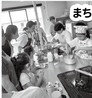
↑ 昨年の夏休み親子企画！サンモツツァから。6年生がサンモツツァの作り方を紹介しました。