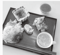
↑ 卵づくしの中華メニュー