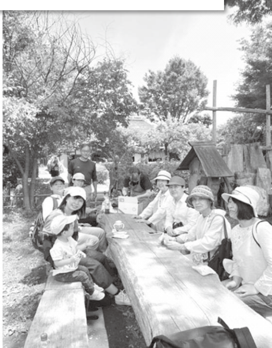
喜多見の農地と古墳を訪ねるまち歩き

5名のまち委員、それぞれが得意分野を生かして活動しています。あなたのできることをぜひ一緒にやってみませんか。