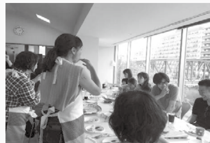
↑ワイン&ティーパーティー