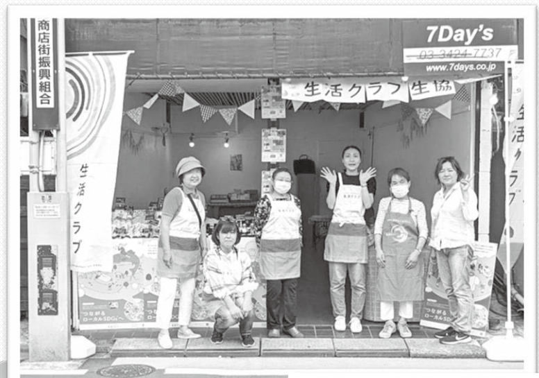
貸店舗前でのまち委員の写真