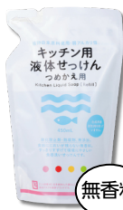
キッチン用液体 せっけん(詰替用)