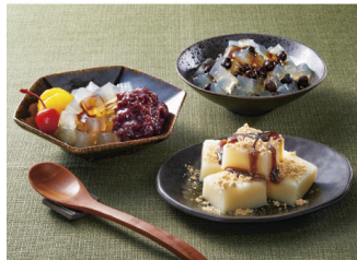
贅沢逸品豆乳きな粉餅 あんみつ まめかん 詰合せ 4,763円