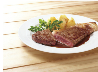
冷凍牛肉ステーキとバター セット (2枚入り) 5,702円