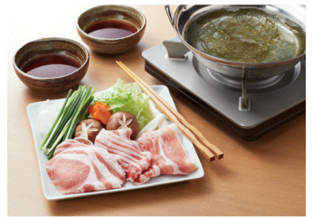
日本の米育ち金華豚 しゃぶしゃぶセット 6,026円