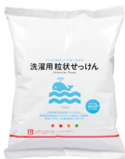
洗濯用粒状 せっけん

お気に入りのせっけんは よやくらぶ 登録が便利! ▼これらの品目は通常価格よりすべてオトク!