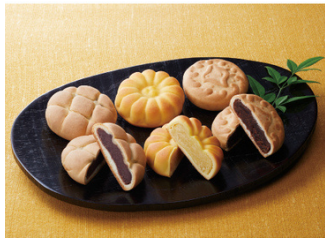
紅葉堂のおまんじゅう 2,624円