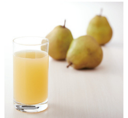
ラ・フランスジュース 4,201円