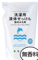
詰替用洗濯用 液体せっけん