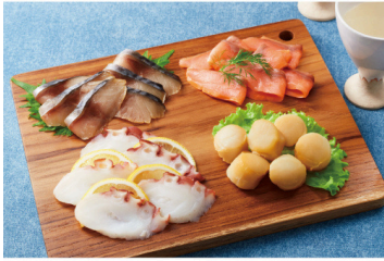
北海道産海鮮スモーク詰合せ 5,076円