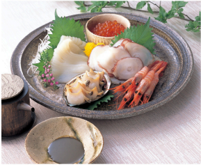
東しゃこたんお刺身詰合せ 5,141円