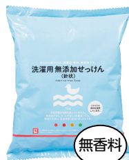
洗濯用無添加 せっけん(針状)