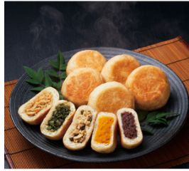
焼きおやき5種セット 5,292円