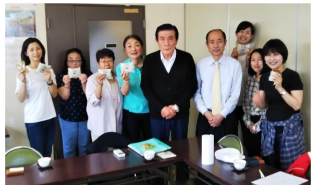
♪紅葉堂のみなさま、ありがとうございました♪

※消費材: 取り扱う食品や生活用品を、利益を得ることが目的の「商品」ではないという意味を込めて、消費材(しょうひざい)と呼んでいます。