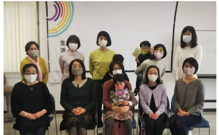
新旧のまち委員とまち大会実出席の代議員 今年もマスクで！

これからも組合員活動に様々な形で参加し、意見を述べて、まち江東をより活発なまちにしていきたいと思います。