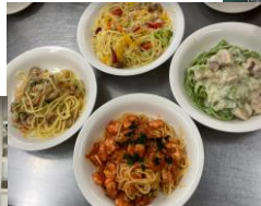
◀生産者提供のレシピで作った4種のスパゲティはどれも簡単で美味しい。 ※レシピは次月号以降でご紹介します♪

改めて、このスパゲティを食べないと損!という気持ちにさせられた生産者交流会。みなさんもぜひ利用してください!!