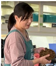
◀スパゲティを押し出すブロンズダイス。摩擦により発生する熱を抑えるためゆっくり製麺する。

前半の生産者からのお話は、生産性よりも品質を追求した製造工程や生活クラブの消費材だけの特長など、直接、聞かなければ知り得ない情報が盛りだくさん。後半は参加者の皆さんで4種類のメニューを調理・試食し、心もお腹もいっぱいになりました♪