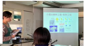
▲小麦の粉碎工程の説明。小麦の中心部である胚乳を市販品よりも多い70%まで削る。