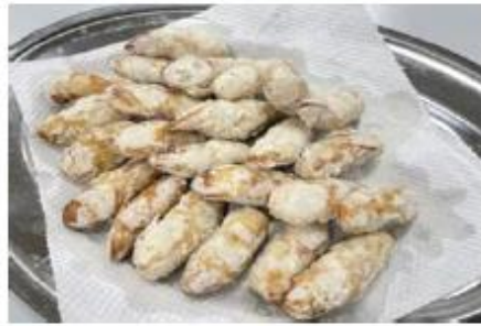
アメリカンドッグ♪