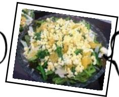
甘夏の スプリング サラダ