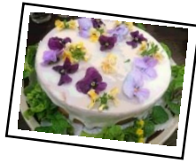
甘夏 フラワー ケーキ