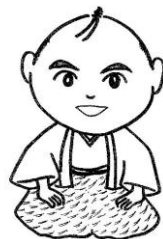
松葉の介 松葉ダイオキシン調査 マスコットキャラクター

口座記号番号:00170-8-402288 加入者名:松葉のダイオキシン調査実行委員会