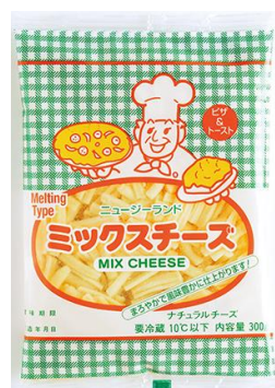
雪印メグミルク(株) 300g 本体 680 円(税込 734 円)

おすすめ消費材は全酪のミックスチーズです。我が家の冷蔵庫に常に予備の一袋が入っています。平日の朝食にピザトースト、休日のオムライス代わりに卵にチーズを入れてスクランブルエッグを作り、炒めたご飯にトッピング。スパニッシュオムレツにたっぷりのミックスチーズ、お酒のおともに、油揚げに長ネギ・キノコと一緒にチーズを入れてフライパンでじっくり焼いてからし醤油でなど、いろいろ料理に使って食べています。もちろんドリアやグラタンには使います。常に使っていない一袋があるように OCR で注文しています。オープンで焼き目のついたチーズも他の食材と一緒に隠し味のようにになっているものも好きです。カルシウムの補給源としても便利です。(長谷川則子)