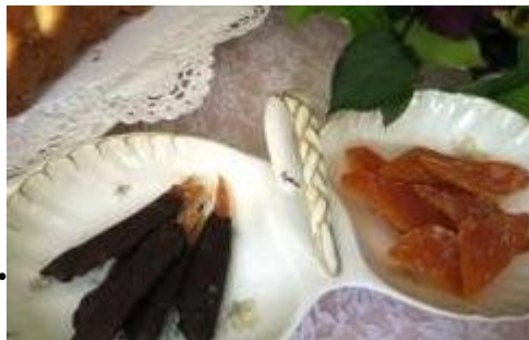
チョコレート ピール