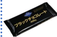
ブラック チョコレート

ミルクチョコレート/ ブラックチョコレート クーベルチュールチョコレート。このチョコレートを食べてく生活クラブに入っている人もいるくらいです。製菓用として何を作っても美味しくできます♥。こどもは硬いのにそのまま割って食べてしまいます。(佐野)