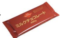
ミルク チョコレート