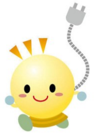
生活クラブでんきのイメージキャラクター「でんきくん」

生活クラブ生協が設置した発電所のほか、生活クラブの食材などの生産者が設置した発電所、地域の市民発電所、縁あって繋がった発電所などから調達しています。