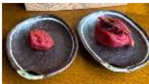
↑ いつもの梅干し ギフトの南高梅