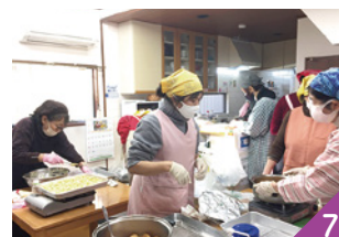
エコロ子ども基金助成先「みんなが育つねりま」による「おおいずみ子ども食堂」

緊急物資配達受取訓練は4ブロックで実施し、エコロたすけあい制度の活用だけでなく、防災・減災をテーマに地域におけるたすけあう関係性づくりを推進しました。コミュニティの状況を共有しながらサポート体制を検討しています。