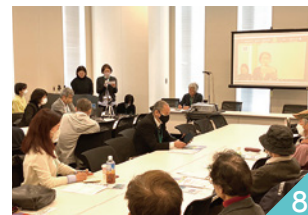
安保関連3文書改正反対の院内集会