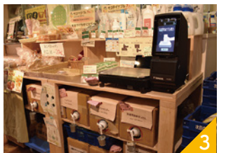
デポー石神井のせっけんの量り売り

20年以上プラスチック類の環境汚染の問題に取り組んできた経験を活かし、デポー石神井での脱プラに取り組んでいます。受け入れられるか心配の声もありましたが、組合員からの応援も後押しになり、定着してきました。液体せっけんの量り売りはプラ削減に加え価格メリットもあり、せっけんの利用にもつながります。脱プラがもっと進むよう知恵を絞ってまいります。