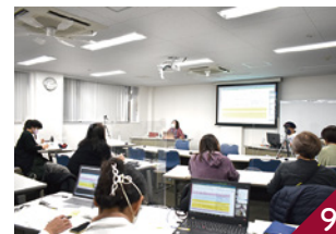
コネクト推進機構の広報研修