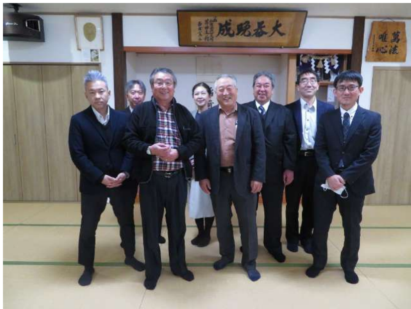
芹田自治会館にて。中央左：竹花会長。中央右：荒川前会長