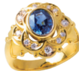
K18 サファイアリング (S=1.59ct D=計 0.23ct) 599,900円→ 299,000円