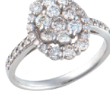
Pt ダイヤリング (D=計 1.00ct) 230,900円→ 161,000円