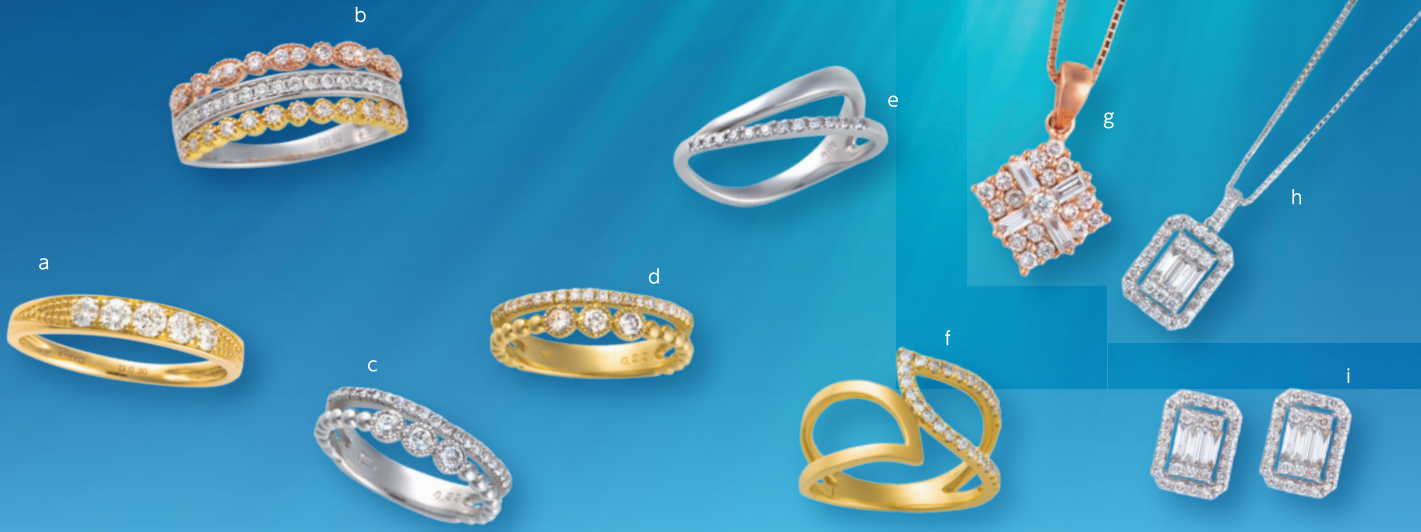
a. K18 ダイヤリング (D=計 0.30ct)