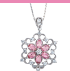
K18WG ピンクトルマリン ペンダント (PT=計 1.13ct D=計 0.46ct) 250,900円→ 175,000円