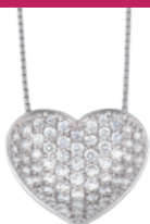
Pt ダイヤペンダント (D=計 2.00ct) 594,900円→ 415,000円