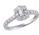
Pt ダイヤリング (D=計 1.00ct) 330,900円→ 231,000円

※価格はすべて税込です。お品切れの際は何か卒ご容赦ください。※掲載商品は、拡大または縮小している場合がございます。