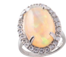
Pt オパールリング (OP=8.52ct D=計 0.81ct) 1,188,900円→ 594,000円