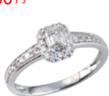
Pt ダイヤリング (D=0.31ct・I・VV52 D=計 0.27ct) 360,900円→ 252,000円