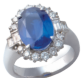
Pt サファイアリング (S=5.84ct D=計 1.06ct) 2,809,900円→ 1,400,000円