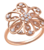
K18PG ダイヤリング (D=計 0.35ct) 187,900円→ 130,000円