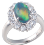
Pt ブラックオパールリング (BOP=2.11ct D=計 0.98ct) 1,265,900円→ 632,000円