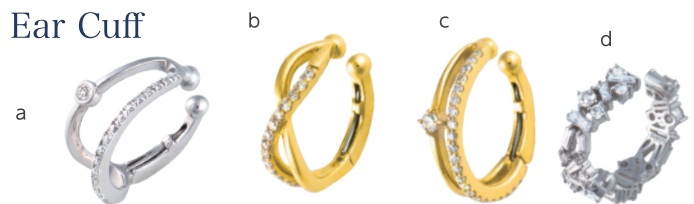
a. K18WG ダイヤイヤークフ (D=計 0.11ct)