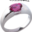
Pt ロードライトガーネットリング (G=2.12ct) 180,900円→ 126,000円