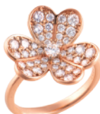
K18PG ダイヤリング (D=計 0.93ct) 275,900円→ 192,000円