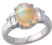
Pt オパールリング (OP=2.01ct D=計 0.35ct) 594,900円→ 297,000円