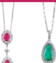
Pt エメラルドペンダント (E=0.43ct D=計 0.12ct) 330,900円→ 231,000円