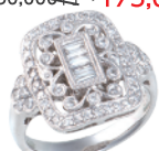
Pt ダイヤリング (D=計 0.68ct) 398,900円→ 278,000円