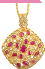
K18 ルビーペンダント (R=計 1.65ct D=計 0.23ct) 495,900円→ 346,000円