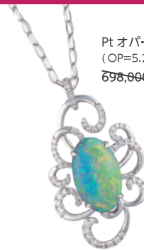
Pt オパールペンダント (OP=5.23ct D=計 0.53ct 70cm) 698,900円→ 349,000円