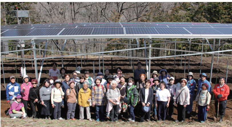
今年春に竣工した共同発電所SO・LA・MI♪1号機とワイン用ブドウ植樹参加者

生活クラブは両社と提携し、組合員への電力の供給源としてソーラーシェアリング発電所建設の共同事業に取り組んでいます。