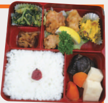
1日180食を作っています

高齢になっても、住みなれた場所で安心して自立した生き方をしたい。そのためには「好きな時に」食から届けてくれる配食サービスが必要と考えた仲間たちが、配食サービスがまだ一般的でなかった約30年前に、加多厨を立ち上げました。