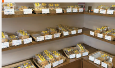
小平市の特産品にもなっています