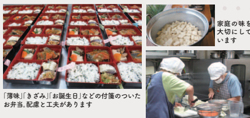
「薄味」「きざみ」「お誕生日」などの付箋のついたお弁当。配慮と工夫があります