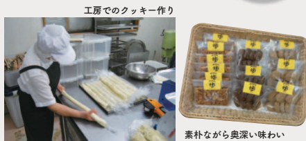
工房でのクッキー作り