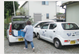
6台の配達車が順次出発