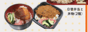
日替弁当と并物(2種)