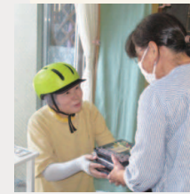
自転車でお得意さんに配達。「毎回楽しんでいます」の声がうれしい