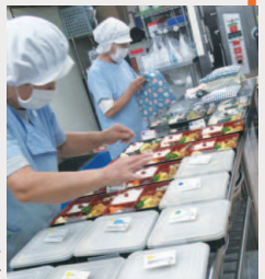
詰め終わると蓋をして名札をのせ、手作りの袋に入れます