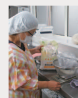
ごはんは「那須山麓米」と「黒米」。だしは「かつお厚けずり」とりまます