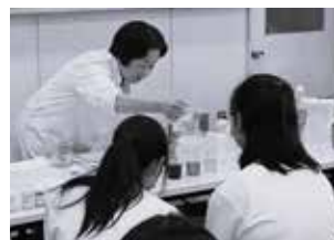
▲添加物講座のようす

畑見学とブルーベリー摘みの後、芽から花まで楽しめる旬の採れたて野菜ランチをいただきます。野菜や料理のお話も伺って、都市の中で食と農にふれる贅沢なひとときを。