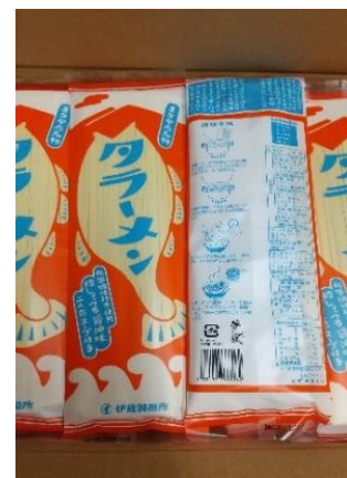
リニューアルしたタラーメン