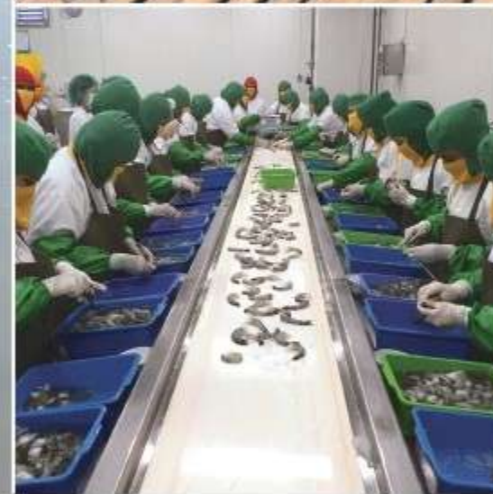
生活クラブのエビ「エコシュリンプ」は、インドネシアの自然環境と調和した粗放養殖池で育てられています (関連記事 P3)