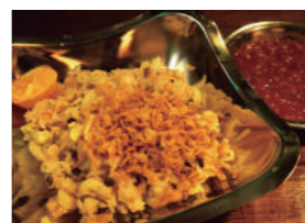
▲店舗で提供しているコシャリ