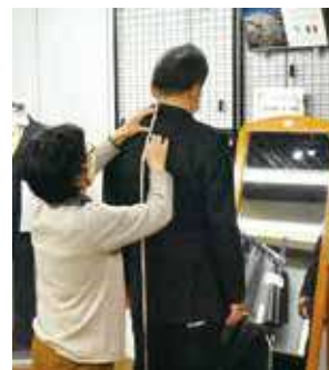
▲丁寧な採寸と聞き取りでイメージに合ったスーツがつかれます