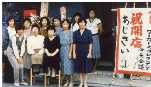
▲1985年に(企)ワーカーズ・コレクティブ クイーンズが仕出し弁当のお店「あじさい」を開店。現在もお弁当の店頭販売や近隣への配達をしています(狛江市)

行っています。10月から「ワーカーズ・コレクティブはたらくの講座」も開講中です。詳細は本紙P6または右の二次コードより、東京ワーカーズWEBサイトにてご確認ください。