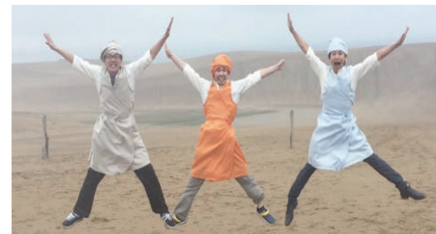
▲アーバンス(合)メンバーのみなさん