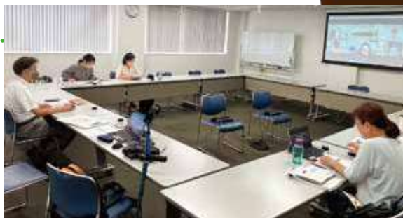
生活クラブのスーツをより多くの方に利用してもらう広報の方法を話し合いました

そこで生活クラブのスーツの良さを多くの組合員に知ってもらうために、「スーツ広報プロジェクト」を立ち上げました。ブロック協会の組合員とベストファイブのメンバーで構成されています。プロジェクトでは、有名海外ブランドの服地が仕入れの中間マージンを省くことでお手頃価格になっていること、無料オプションも充実しており有料オプションもお手頃価格であることなどを再確認しました。参加メンバーが作成したチラシを活用し、組合員発の情報発信を進めていきます。