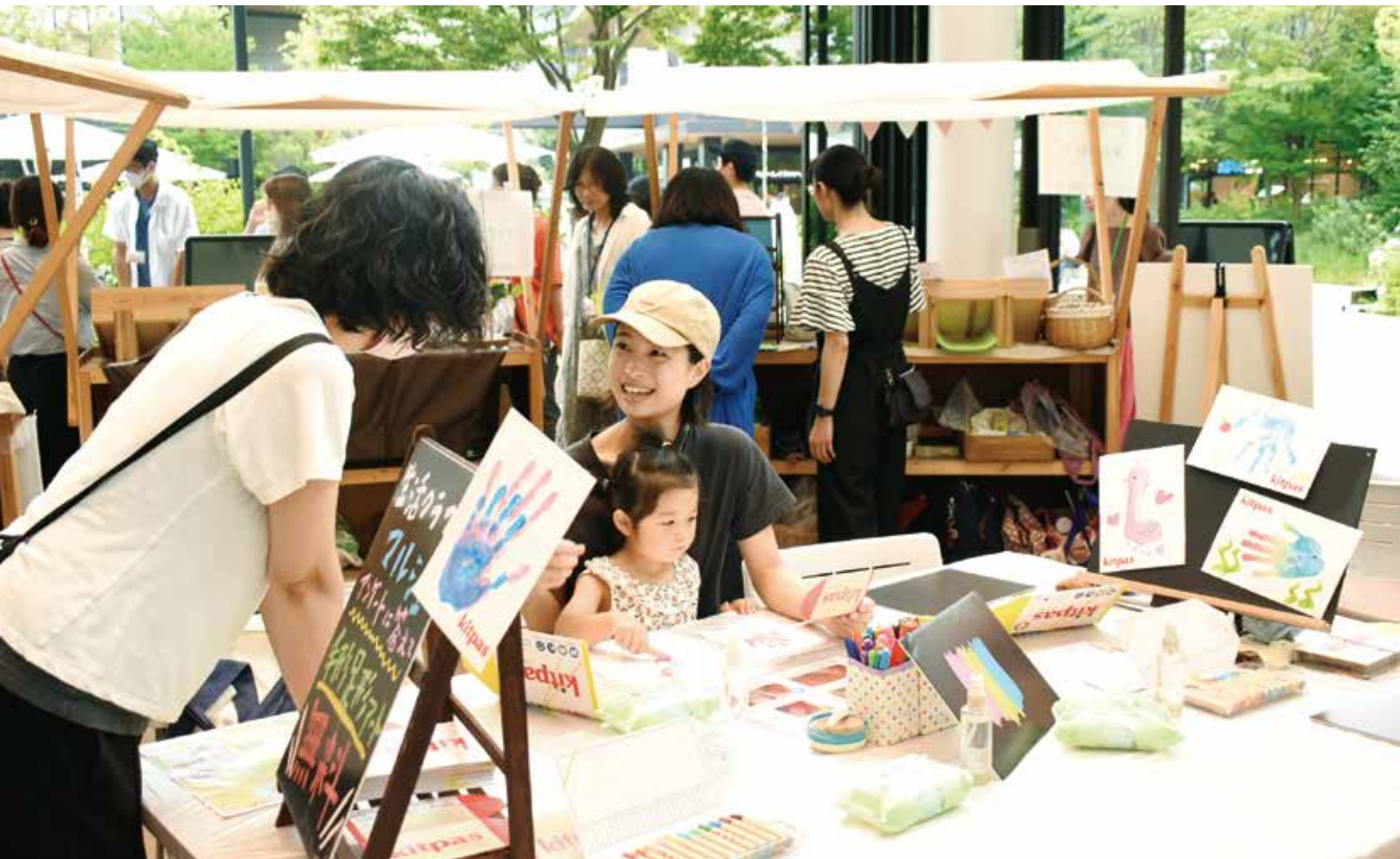
多摩きた生活クラブでは7月8日にGREEN SPRINGS（立川市）でマルシェを行い、地域の方に生活クラブを紹介しました（関連記事 P2）

生活者・生産者をむすぶ生活クラブ（エス）を楽しみ、参加する（エンジョイ&ジョイン）ための情報提供がジョイエスの役割です