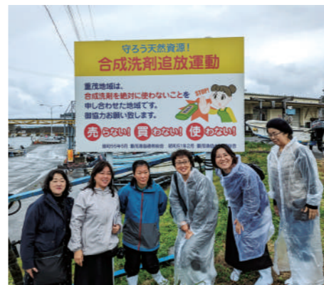
▲漁港に設置されている看板

「天恵戒驕」海を守り、山を守った。初代組合長の教えが生きている重茂の生産者出合いの旅 天然あわび・養殖わかめ日本一!