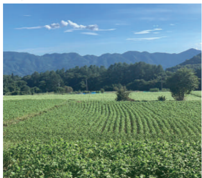
▲標高1000mの本社横にある広大なそば畑