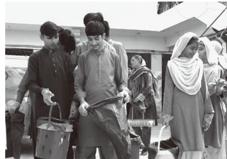
アル・カイルアカデミーの生徒による学校周辺地域の清掃活動。生徒たちは自らの活動が地域に変化をもたらすことを実感している

NPO 法人 JFSA (日本ファイバーリサイクル連帯協議会) は、古着などを回収し国内外で販売することで、子どもたちが無料で通う学校アル・カイルアカデミーの支援を行っています。生活クラブでも 2000 年から呼びかけを開始し、のべ 39,756 人 (2023 年 12 月 25 日現在) の組合員が参加してきました。