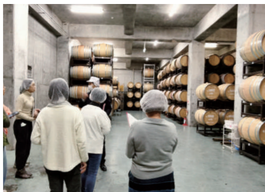
▲ワインの熟成樽が並ぶ地下のワインセラー

徹底した品質管理! まじめでおいしいワイン 塩尻市にあるワインの生産者、(株)アルプスを訪問し製造工程を見学しました。ぶどうの残留農薬検査・震災前からの放射能検査・重金属検査など、生活クラブと提携する前からさまざまな検査をしているそうです。品質管理が徹底しており、消費者に対する誠実さを感じました。 3月より取組み予定の新しい消費材「酸化防止剤無添加ワイン白Rびん」の試飲をしました。食事と相性のよいやや辛口タイプで、すっきりとしてとても飲みやすくおすすめです!