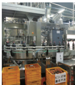
▲割れや異常は目視で点検 (ぶどうジュース)