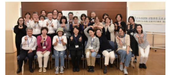
住民ドゥレ生協の役員(前列左から7名)と生活クラブの役職員

その後の送別会には生活クラブ東京の理事や組合員も参加し、言葉の壁を越えて、協同組合の仲間として交流を深めました。