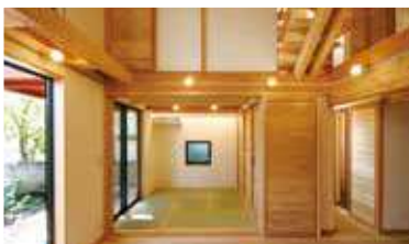
▲和室のあるリビング（新築）

今回、生活クラブ東京の住宅事業の新たな担い手として「(株)生活クラブすまい・る」を設立。生活クラブ東京への信頼と関係性でつながり、組合員の枠を超えて広がってきた相談にも、積極的に取組める体制を整えました。