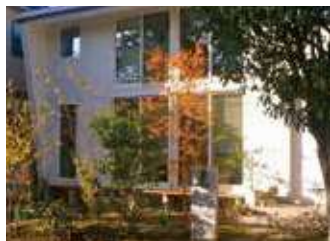
▲庭づくりをともなった新築