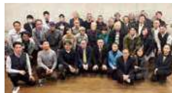
▲(株)生活クラブすまい・るの社員と専門家集団のみなさん

生活クラブの住宅事業を支えるのは、「食」と同じく組合員の利用です。住まいの問題を解決するための新たな道具である(株)生活クラブすまい・ると住宅事業を育てていきましょう。