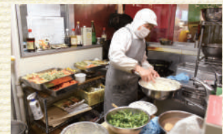
▲都内のデポ-で一番狭い惣菜室

2009年の開所当初、お惣菜やお弁当は館内地下にある「カフェ & ダイニング素々」が販売していたため、デポ-では製造していませんでした。その後、デポ-でも作りたてのお惣菜を提供してほしい、との組合員の声に後押しされてお惣菜づくりを開始しました。