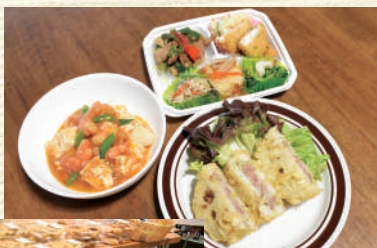
▲(左から)エビチリ、おかずセット、れんこんのはさみ揚げ

自慢の腕と味覚をフル回転し、近隣のスーパーとは一味違うお惣菜を手作りしています。2024年8月のリニューアルでは、店内の一角にカフェの設置を検討しています。作りたてのお弁当やお菓子が、利用者同士の交流の潤滑剤となることをめざしています。