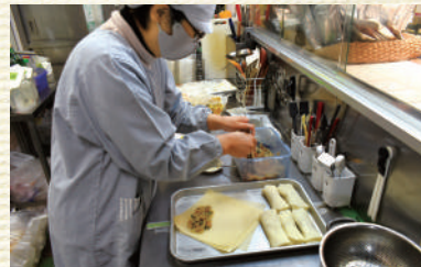
▲一つひとつ丁寧に作っています

多くの人に美味しく食べてもらいたいという思いでお惣菜を作っています。購入したものはカフェスペースで飲食でき、老若男女問わず多くの組合員が利用しています。17年の歴史と思いが詰まったお惣菜を食べに来てください!