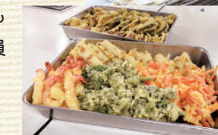
▲さくさくの衣が自慢の天ぷら

世田谷区宮坂 3-13-13 TEL 03-5426-5211 営業時間 10:30 ~ 19:00 定休日 日曜日