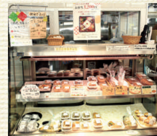
▲ショーケースの奥の窓から調理の様子が見えます

高齢化が進みつつある、地元同士のつながり強い地域にあります。近隣の方の台所として、お昼時には多くの方がお惣菜やお弁当を楽しみに来所します。週に2日、近隣の幼稚園に児童と先生用のお弁当を納品するなど、地域に愛されるデポ-です。