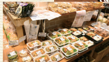
▲色とりどりのお惣菜が目立ちます

エビチリは共生食品(株)の豆腐とエコシュリンプむき身を使い、豆板醤とトマトケチャップなどで味付けをした、旨味と辛味のきいた一品。れんこんのはさみ揚げは、豚肉と長ねぎでつくった餡がおいしさの秘訣。約6分かけてじっくり揚げています。ちょっと贅沢なものから、毎日食べても飽きないものまで、幅広いメニューのお惣菜を用意しています。