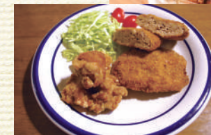
▲唐揚げとメンチカツ

都内のデポ-で唯一、店内でひき肉を挽いています。自前の合挽肉を使ったメンチカツは、お肉の食感が楽しめると人気!お弁当には野菜をたくさん使用しているので、栄養バランスが気になる方にも好評です。6月15日・16日の周年まつりでも、たくさんのお惣菜を用意します。この機会にぜひお越しください。