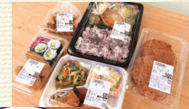
▲お弁当やおかずセット、助六寿司など

高齢化が進みつつある、地元同士のつながり強い地域にあります。近隣の方の台所として、お昼時には多くの方がお惣菜やお弁当を楽しみに来所します。週に2日、近隣の幼稚園に児童と先生用のお弁当を納品するなど、地域に愛されるデポ-です。