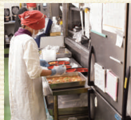
▲彩りよく盛り付けます

自慢の腕と味覚をフル回転し、近隣のスーパーとは一味違うお惣菜を手作りしています。2024年8月のリニューアルでは、店内の一角にカフェの設置を検討しています。作りたてのお弁当やお菓子が、利用者同士の交流の潤滑剤となることをめざしています。