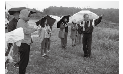
除染作業のために山が半分が削られるなど、原発事故による影響を伺いました