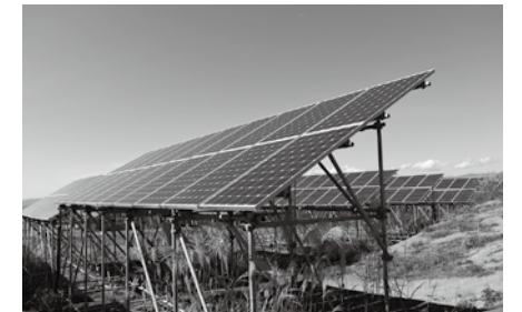
雄国太陽光発電所。大雪でも発電できるよう、2.5mの架台の上に勾配をつけたパネルを設置