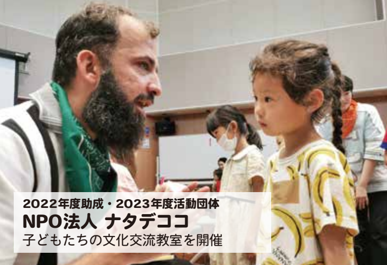
2022年度助成・2023年度活動団体 NPO法人 ナタデココ 子どもたちの文化交流教室を開催