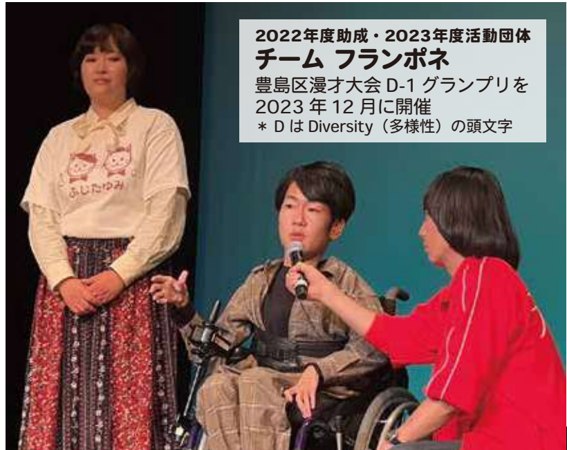
2022年度助成・2023年度活動団体 チーム フランボネ 豊島区漫才大会 D-1 グランプリを 2023年12月に開催 * DはDiversity（多様性）の頭文字