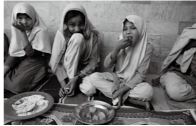
アル・カイルアカデミー第8分校の給食

毎日食べていました。全校生徒の30%位と、先生も貧しい人が多く、一緒に給食を食べていました。給食を食べる生徒は、担当の先生たちが家族の経済状況を調査して決めています。