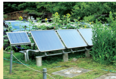
太陽の熱を集める集熱パネル

川遊びや収穫体験の後には、太陽の熱を利用してお湯をつくる「おひさまシャワー」でさっぱり!入村者は自由にシャワーを利用できます。パネルで受け止めた太陽熱が蓄熱タンクに送られ、タンク内の水を約70℃まで温めます。蓄熱タンク内の管を通して温められたお湯を、シャワーとして利用しています。(給湯のシャワーもあります)