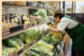
▲消費材をみんなで余さず食べられるよう、野菜の並べ方も手に取りやすいよう整理します

デポーは、消費材や生産者に出会える場です。新しく加入し、どんな消費材があるのかまだ分からないという方にこそ来てもらいたいです。ワーカーズで働く良さは「組合員にも消費材にも正直に対応できる」と言ったメンバーがいました。おすすめ消費材や石けんの使い方など、ワーカーズの生の声をお届けするので、ぜひお気軽にお越しください。