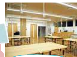
2019年 コワーキングスペース永福併設