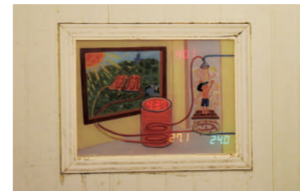
シャワールーム内には現在の水温がわかるモニターがあります