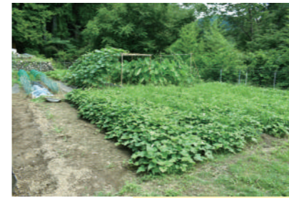
サツマイモなど秋の収穫に向けて栽培中

川遊びや収穫体験の後には、太陽の熱を利用してお湯をつくる「おひさまシャワー」でさっぱり!入村者は自由にシャワーを利用できます。パネルで受け止めた太陽熱が蓄熱タンクに送られ、タンク内の水を約70℃まで温めます。蓄熱タンク内の管を通して温められたお湯を、シャワーとして利用しています。(給湯のシャワーもあります)