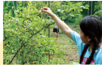
ブルーベリーの収穫体験。 キウイフルーツ、みかんなどの収穫も