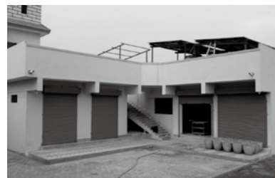
新たに第8分校のそばに大規模なセントラルキッチンを建築中。生徒1,000人以上に対応できます

普段は豆や野菜のカレーですが、週に2回は肉のカレーの日がありました。手作りなのでとても美味しく嬉しかったです。給食の時は友だちも一緒に楽しい時間でした。私は3人いたボランティアメンバーの一員としてダスタルハーン(食事の時に床に敷く布)を敷いたり、水や料理、食器を配膳する手伝いをしていました。