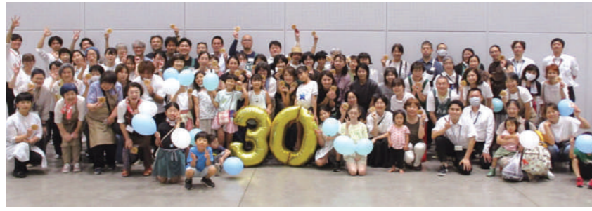
▲30周年イベント「おいしさのヒミツ体感フェス！」(2024年7月開催)では、たくさんの組合員が当日のお手伝いに参加しました