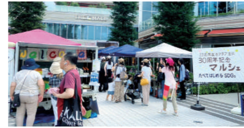
▲「30周年記念マルシェ たべてはじめるSDGs」@パークシティ武蔵小山ザ・モール(2024年9月7日・8日開催) 組合員、生産者、運動グループが大集合！駅前とあって、多くの人に生活クラブをアピールできました