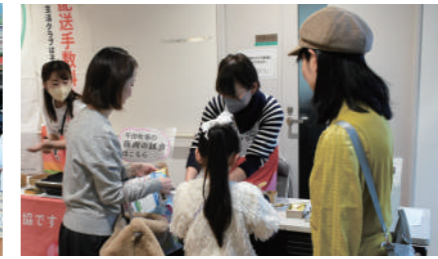
▲中央区勝どきにある約2,800世帯の高層マンション自治会のイベントに出展。豚肉試食会を掲載したパンフレットを全戸配布し、当日14人・後日1人が生活クラブに加入しました(11/30現在)