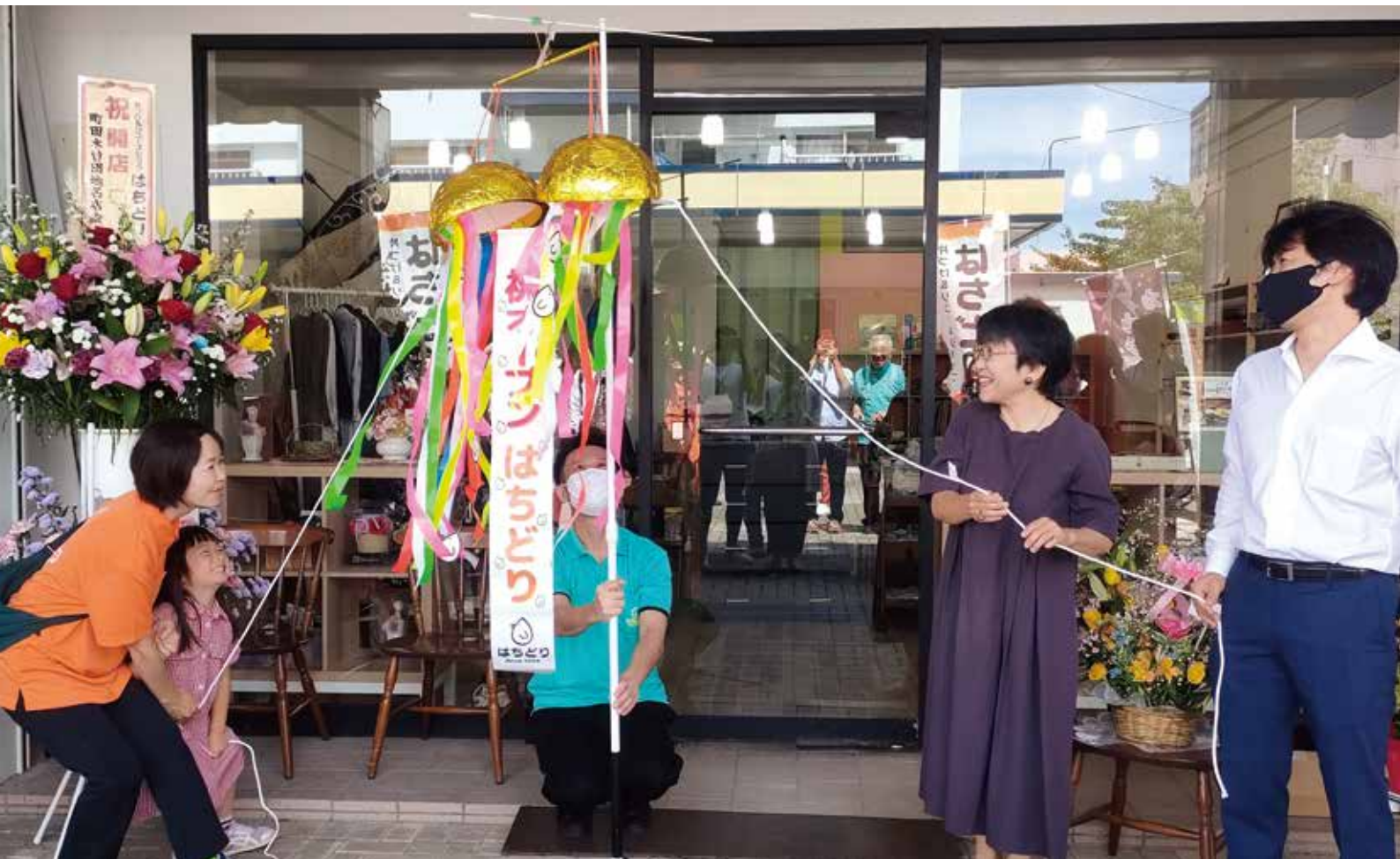
インクルファンド助成を活用し、2024年6月、町田市に「共に働く事業所 片づけ&リユースショップ はちどり」がオープンしました。誰もが住みやすい地域づくりに向けて、組合員の意志あるカンパが活用されています（関連記事 P2）

生活者・生産者をむすぶ生活クラブ（エス）を楽しみ、参加する（エンジョイ&ジョイン）ための情報提供がジョイエスの役割です