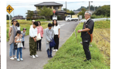
▲「お肉も牛乳もお野菜もお米もまるごと生産者を訪ねる旅」に参加。栃木の産地で生産者と交流しました