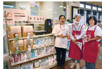
▲10月には都内のデポー2店舗目のせっけん類量り売りを開始しました