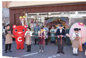
▲8月17日・18日のリニューアルオープンには2日間で976人が来所し、おおぜいの組合員と生産者と賑わいました