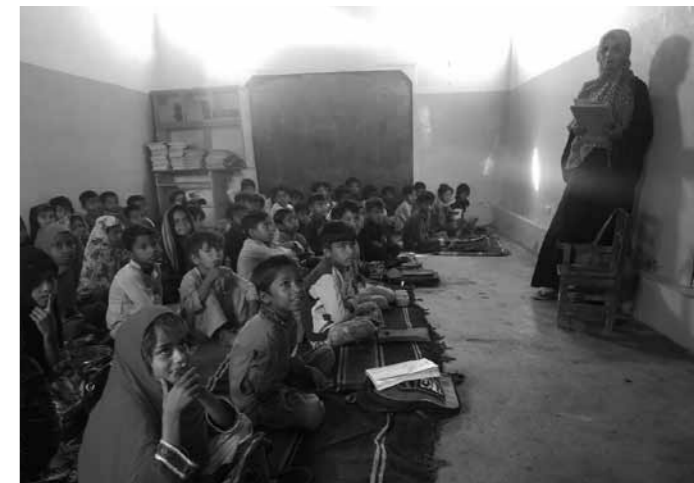
アル・カイルアカデミー第2分校で学ぶ生徒たち

NPO法人JFSA(日本ファイバーリサイクル連帯協議会)は、古着などを回収し国内外で販売することで、子どもたちが無料で通う学校アル・カイルアカデミーを支援しています。生活クラブでも2000年から呼びかけを開始し、のべ41,792人(2024年12月末現在)の組合員が参加してきました。