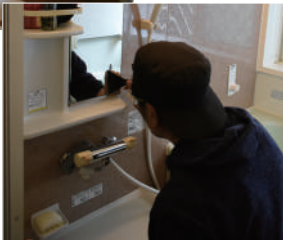
へラで浴室鏡の水垢落とし▶