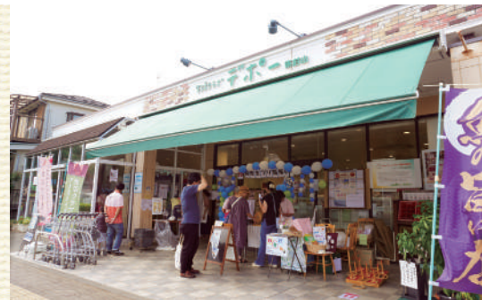
▲デポー東村山も5月にリニューアル

生活クラブのお店「デポー」はただのスーパーではありません。組合員が運営し組合員が利用する、まさに「組合員のお店」です。店舗業務は組合員が組織したフロアワーカーズ（以下ワーカーズ）が担い、ワーカーズ以外の地域の組合員もワークなどを通じて運営に携わっています。さらにまち活動やサークルなどさまざまな活動の場となるまちづくりの拠点でもあります。