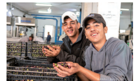
▲生産者の息子たち。製油所へ運ぶ手伝いをします