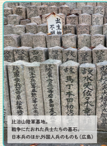
比治山陸軍墓地。戦争にたおれた兵士たちの墓石。日本兵のほか外国兵のものも（広島）