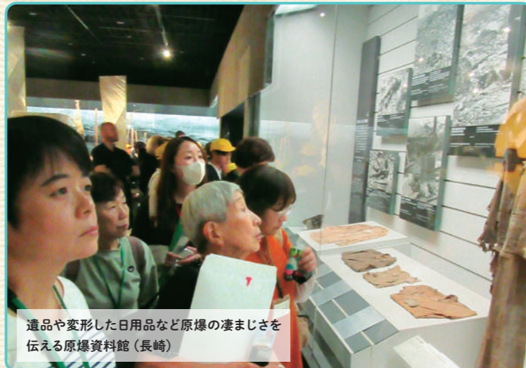
遺品や変形した日用品など原爆の凄まじさを伝える原爆資料館（長崎）

東京の被爆者団体として活動してきた「東友会」と東京都生協連が主催。都内のさまざまな生協の組合員が、被爆者の方と共に現地を歩く平和の旅です。