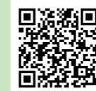
▲フォーラムの開催報告はこちら