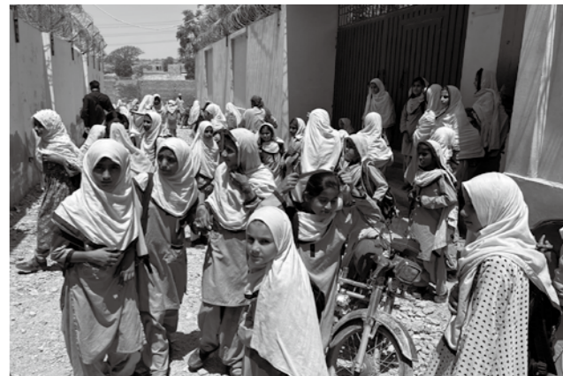
下校する第8分校の生徒たち

*1 アル・カイルアカデミー:パキスタン最大の都市カラチ市にある、本校・分校・カレッジをあわせて約6,500人が学ぶ無料の学校。1987年にカラチ市のスラムで設立しました