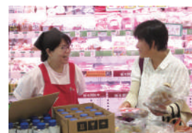
デポーを運営するフロアワーカーズも労働者協同組合の法人格に