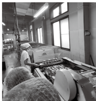
胡麻だくさんせんべい専用の焼機。 長さは13mにもおよび機械の近くは50℃以上になる