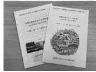
過去の5カ年計画(第5次、第6次)

まとめています。すぐには、またひとりでは実現できないことも多いです。長いスパンで多様な人を巻き込み、一年ごとにどこまで来たか、何が足りていないかを確認しながら、実現に近づけていきます。