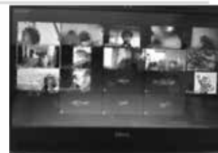
3/6 のオンライン生産者交流会の様子

データ通信料がかからないことを前提にしますので、インターネット環境の確認をお願いします。