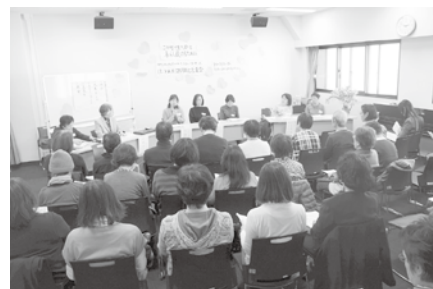
2019年度のまちづくりフォーラムの様子

働くことを自己表現のひとつととらえ、生活者としての知恵をいかしつつ、全員で出資・運営・労働を担うワーカーズ・コレクティブという働き方をしています。地域で働くことにこだわりを持ち、一人ひとりに寄り添いながら、ACTと連携した「ACTつながるケア」や、2000年からは介護保険などの公的サービスを行なっています。沢山の利用者さんとの出会いや思いに触れ、感動や刺激をいただける毎日です。ケア活動を行ないながら地域の団体と共に住みよいまちづくりをめざして、2005年に配食サービス「はあとほっと」が独立、2016年には地域協議会の活動からまちの縁がわ「わ・おん」が設立され、たくさんの地域の方に利用されています。