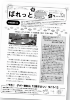
生活クラブ運動グループ・東村山地域協議会の機関紙

生活クラブ運動グループの団体が構成されている地域協議会が発行しています。各団体の活動や企画を掲載しています。