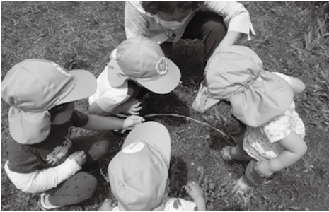
どんぐり保育室 園児たちの外遊びの様子

「地域にたすけあいの仕組みが必要だね!」の思いを持った組合員が集まり、2001年に任意団体を設立しました。武蔵野市の福祉は行政リード型と言われ、おおむね市民のニーズに答えられている状況でしたが、制度ではカバーできない多様な「困った」があるはず!とそれらを事業化し、公的制度に参画しながら、2008年には武蔵野市補助金事業「テンミリオンハウス事業」を受託、「くるみの木」の事業を開始し、ミニデイサービスのプログラムとランチを提供しています。2012年には「どんぐり保育室」を開設、現在は市の認可による「小規模保育事業B型」で0歳から2歳までの10人の子どもの保育をしています。