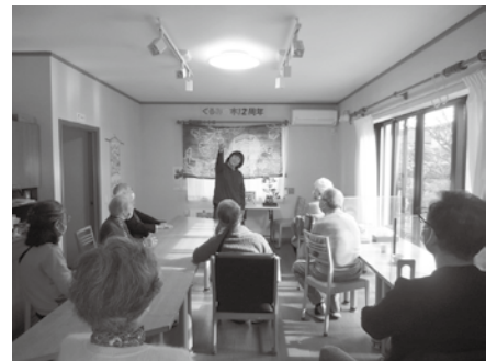
テンミリオンハウスくるみの木 室内プログラム

困難を抱える子どもはもちろん、子育て中の親子のくつろぎの場所として、地域協議会(まち・武蔵野を含む、生活クラブ運動グループの団体が集まった会)の有志が中心となり、生活クラブの消費材も使った「みかづき子ども食堂」を開始、コロナ禍で一時中断しましたが、フードドライブに切り替え活動を継続しました。2021年4月から「子ども食堂」を少人数単位で月1回、地域の商店街で再開しています。これからも地域に必要とされるワークズとして、だれでも立ち寄れる「居場所」も作るなど、互いに支え合う輪を広げていきたいと思ひます。