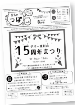
まち・東村山の機関紙

いろいろある広報紙、実は、これらのほとんどが「活動」で作成されています。それぞれ作り手と対象が異なり、発行元を見ると、どんな組合員が作成しているかがわかります。生活クラブでは、組合員が思い思いの形で発信することも大切にしています。