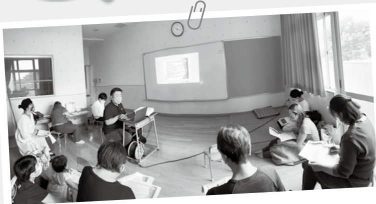
2021年7月 まち・あきるの 「あきるのにワーカーズ・コレクティブをつくろう！」 多世代が集まって、地域で働く場についてどんなことが出来るか話し合っている様子

まち活動は、ほとんどが行政区単位で行っており、組合員からのまち活動費で運営しています。 年に1度、まち大会を開催し、まちの代議員が活動方針や予算について討議決定します。 まち委員会は、まちの組合員で構成され、委員長、共同購入委員、まちづくり委員、広報、会計 などを分担しています。各地域からの意見をまとめ、まち活動の予算執行を担います。