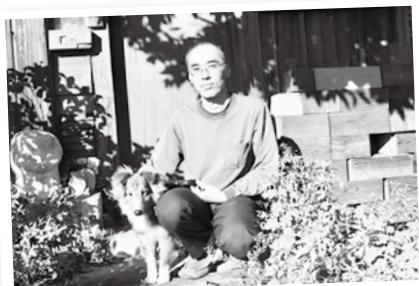
木で家をつくると端材(こっば)がたくさん出ます。これを使って、プレーパークで子どもたちが木工をしています。

木と人の相性はほんの小さなことからわかるもの。無塗装の杉の床を冬もハダシで！ 拭き掃除をした後の足裏感は何にも代え難いものです。輸入される木材には防腐防虫の薬剤処理がされています。ぜひ国産材を選んでいただきたいと思います。