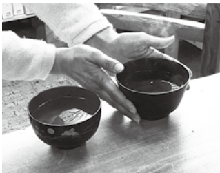
熱さを伝えにくい木製のお椀は子どもにもおすすめです

酒井産業(株)は、信州の木曽で生まれた生産者です。 未来へ健全な森を引き継ぐこと、特に子どもたちに森の大切さや木のぬくもりを伝えたいと、国内の多くの木材産地と提携し木と竹の生活用品を作っています。