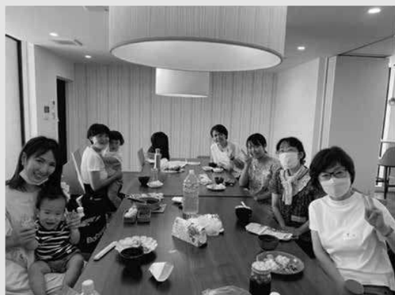
マンション集会室で防災クッキング