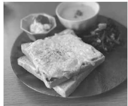
多摩きたSNSでも詳しく紹介中

作り方 ①食パンに味噌を塗る。(塗りすぎにはご注意ください) ②上からチーズをのせて、トースターで焼いて完成。 ※お好みでブラックペッパー、パセリ、マヨネーズ、玉ねぎ(1/4個)などを追加しても美味しく召し上がれます。