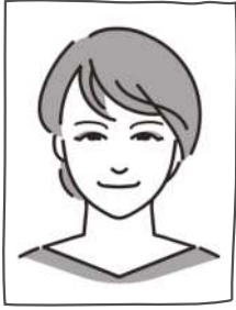
まち・東くるめ 組合員

組合員数 （2023年2月末） 15,309人 （2023年2月末） 5,809人 加入者数 （2022年度累計） 1,209人 （2022年度累計） 501人 脱退者数 （2022年度累計） -1,192人 （2022年度累計） -464人 総利用高 38,507,920円 （3月配送） 世帯当り 25,570円 （3月配送） （3月29日現在）