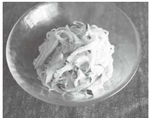
多摩きたSNSでも詳しく紹介中