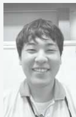
小平センター やしる せいが 八代 清河

最近、ゴルフにハマっています。休日は、天気の良い日に自分のボールを、きれいなグリーンに飛ばして仕事のこと忘れて、すぐリフレッシュできます。新しく良いクラブを購入して、上手になりたいと思っています。ゴルフは誰でも楽しめるので、皆さんもチャレンジしてみたいかと思いますが、休日にしっかりリフレッシュして、しっかり仕事に打ち込みたいです！