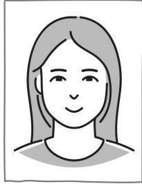
まち・あきろの 組合員