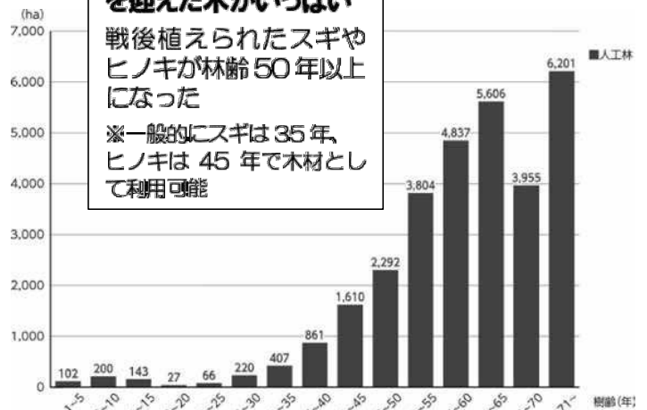
多摩地域の人工林(民有林)の林齢別森林資源構成 出典「東京の森林・林業(令和4年度版)」