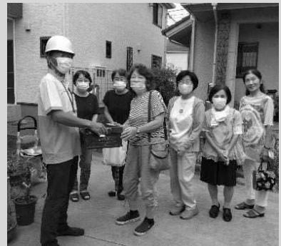
毎年参加している配達訓練

今後のこと 柴崎会館などで茶話会を開き、小さな困りごとをみんなて話し合えるような関係作りができるといいと思います。