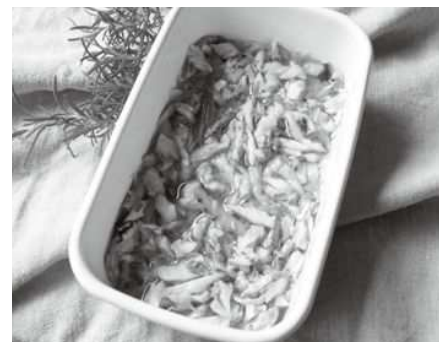
多摩きたSNSでも詳しく紹介中