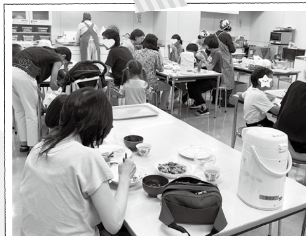
ひとり親で子育てをしている方が「子どもと二人きりじゃないこの時間が必要」と言っていたそうです