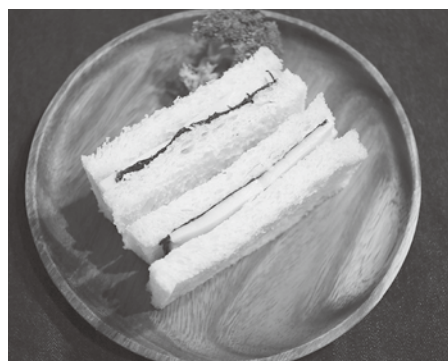
多摩きたSNSでも詳しく紹介中