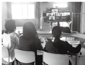
2023年12月オンラインでの モニター交流会の様子