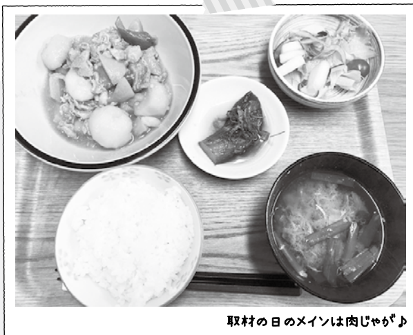
取材の日のメインは肉じゃが♪

デポ-東村山から、消費期限が近くなった肉や魚、野菜の提供があり、とても助かっています。